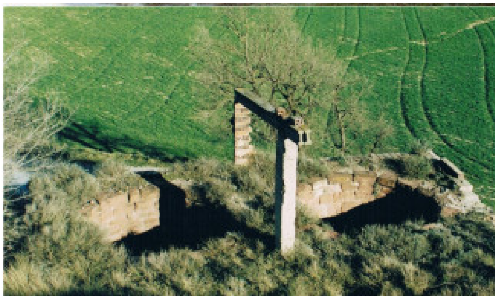
Figura 5: Múnter (Muntanyola). Hornos de yeso circulares.

la moltura de esta forma. A partir de estos años, se muele eléctricamente y se cuece en el forn del Soler. A principios de los años 30, se adquieren los primeros camiones y se amplían las rutas comerciales, hasta localidades del Barcelonès y Vallès Oriental.