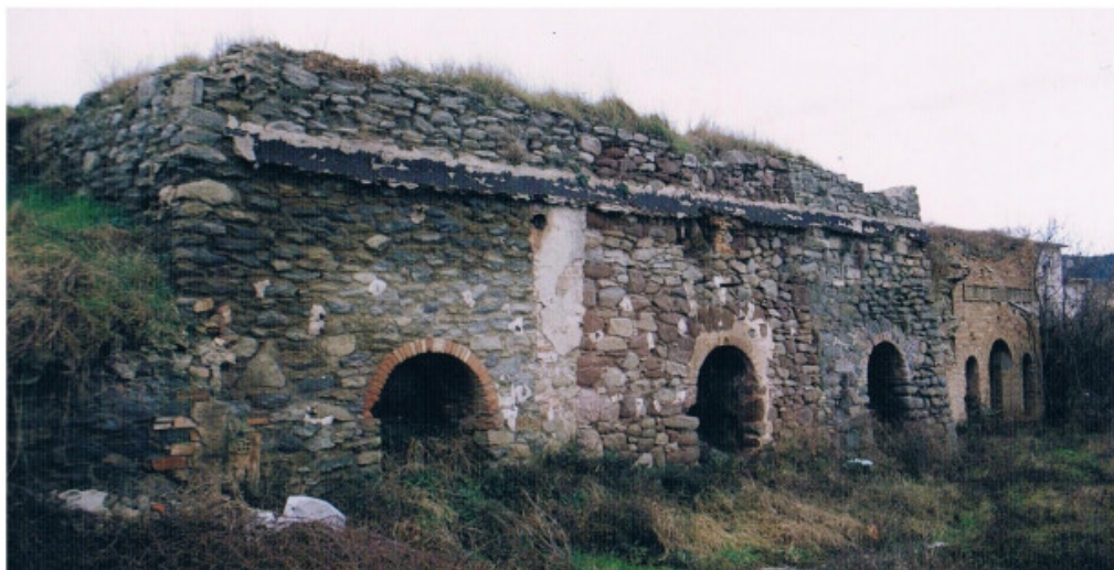
Figura 8: Tona. Conjunto de hornos de una antigua fábrica de yeso a las afueras del pueblo.

dian por toda la comarca de Osona, sobretudo en Vic, Manlleu, Roda de Ter y Torelló y en las comarcas del Vallès Oriental y del Barcelonès. Se distribuía en camiones, conducidos por trabajadores de la misma empresa.