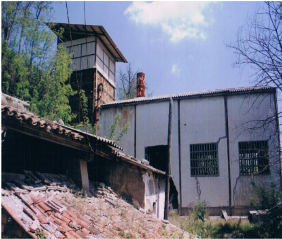
Figura 6: Santa Eulàlia de Riuprimer. Fàbrica de yeso del cementerio actual.

14.000 o 15.000 aproximadamente. Este hecho, comportó una reducción del personal que se ocupaba directamente en los trabajos de la yesera. Otro factor esta reducción, fue que no se extraía yeso local, si no de La Pobla de Lillet (Berguedà).