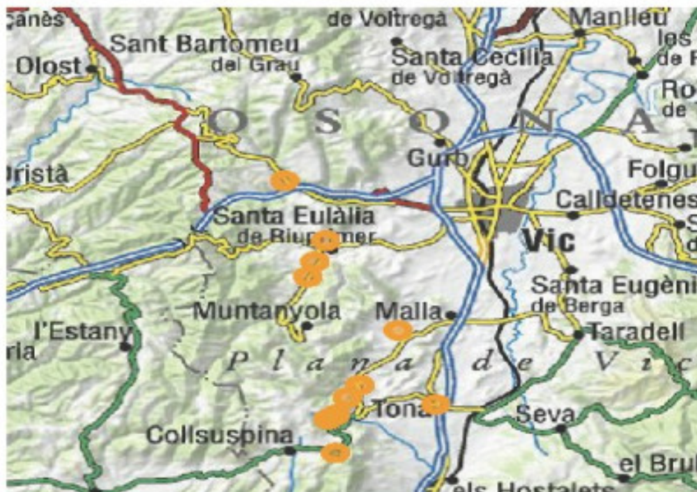
Figura 2: Situación geográfica dónde se conservan canteras de yeso, hornos aislados y fábricas de yeso, en la comarca de Osona.

cia, en las explotaciones de Tona (2) situadas sobre el Torrent de Güells, sólo se hallan las canteras y alguna barraca de los canteros. En este caso, las canteras se sitúan alineadas con los afloramientos yesíferos (figura 2).