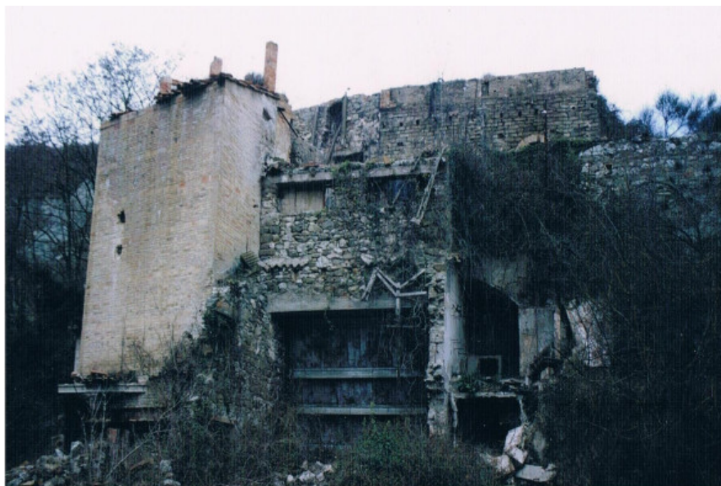
Figura 7: Tona. Fàbrica de yeso de Vall-llobera.

NAS COMA (seguramente hermano de Alberto BAULENAS COMAS, explotador de la cantera "Floriac" de Collsuspina). Con 4 obreros en la cantera, se extraía un total de 2.500 metros cúbicos anuales (unas 5.570 toneladas), según la producción del año 1974.