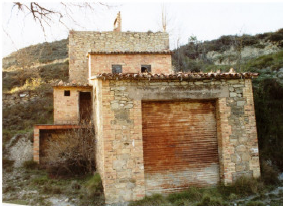
Figura 4: Múnter (Muntanyola). Horno de Yeso.

La fábrica tenía una era para triturar el yeso y los trabajadores se servían del hostal de La Barroca (actualmente La Bestreta). En los años 70 cerró definitivamente la fábrica de yeso (PLADEVALL, 1990).