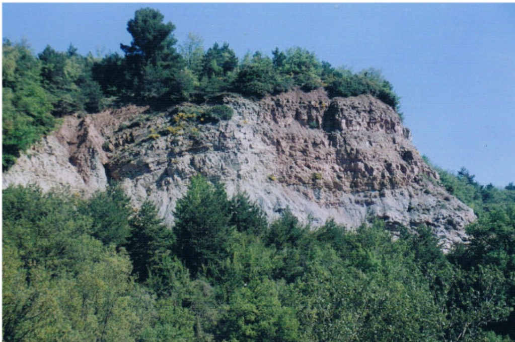
Figura 3: Collsuspina. Talledes de l'Oller. El yeso formando un pequeño diapiro entre las margas oligocenas.

Abunda el topónimo “La Guixera”, que en castellano significa “la yesera”, lugar dónde hay yeso, o simplemente la cantera de yeso. Aunque en catalán existe un doble significado, en que se refiere a la fábrica de elaboración y manipulación de yeso. Otros topónimos menos comunes, son los que se refieren al horno de yeso (Forn del Guix) y a la persona con el oficio de yesero (Cal Ros Guixer).