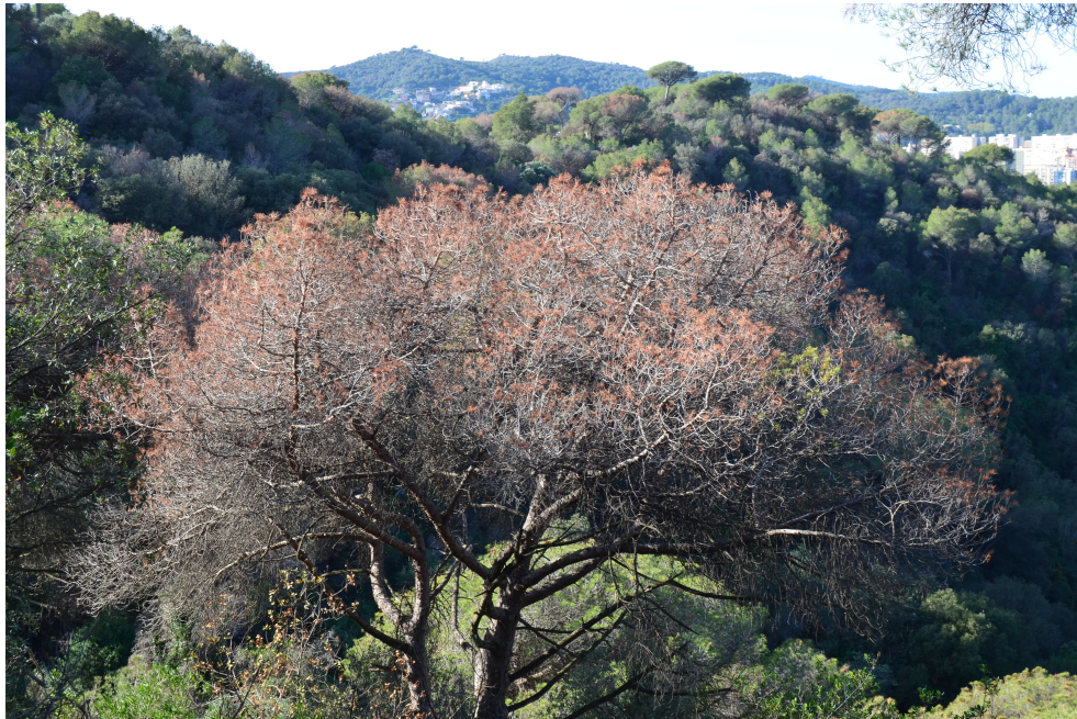
Figura 2: Pi blanc (Pinus halepensis) afectat per la sequera. Vessant del camí de la Font de l'Alzina. Novembre de 2023

Per tot aquest despropòsit, el nostre Centre es posiciona clarament i amb tota la força dels nostres braços i del coneixement científic que ens caracteritza, a favor del DECREIXEMENT en tots els àmbits de la vida: consumir menys,